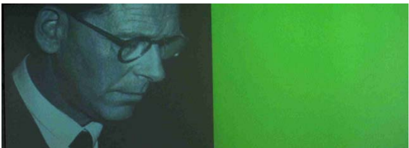
Alt for Norge (2002)

Hadde det bare vært slik at det et sted befant seg onde mennesker som begikk onde handlinger, og at det bare var å skille dem fra oss og så tilintetgjøre dem. Men den linjen som skiller det gode fra det onde – går tvers gjennom ethvert menneskets hjerte. Og hvem er villig til å tilintetgjøre sitt eget hjerte?