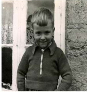
Liten gutt på Lunner 1943 – do you remember me? (2004)